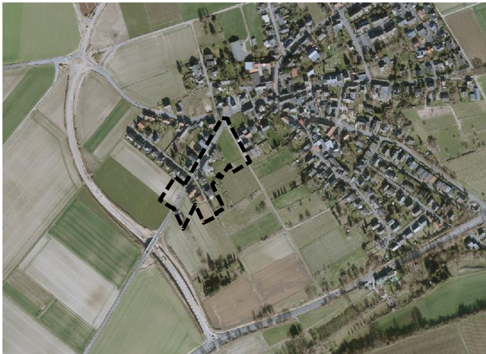
Abb. 1: Standort des Plangebiets - Portal NRW Umweltdaten vor Ort – Ministerium für Umwelt, Landwirtschaft, Natur- und Verbraucherschutz des Landes Nordrhein-Westfalen (02.12.2020)

Die Gemeinde Wachtberg, Ortsteil Gimmersdorf beabsichtigt - aufgrund der anhaltenden, großen Nachfrage an Bauplätzen - im Rahmen des Bebauungsplanes Nr. 04-06 „Auf dem Berg“ die Ausweisung von Wohngebietsflächen auf einer Gesamtfläche von ca. 1,58 ha. Die zur Verfügung stehenden Flächen im Ortsteil Gimmersdorf sind fast vollständig bebaut oder werden zum aktuellen Zeitpunkt bebaut, sodass zusätzliche Flächen benötigt werden, um die weitere städtebauliche Entwicklung sicherzustellen.