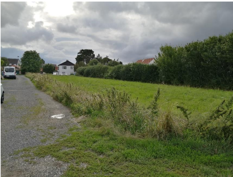
VA3: (Gemeinde-)Straße, EA0: Fettwiese

Die Ackerfläche war zum Zeitpunkt der Begehung mit Kartoffeln bepflanzt. Der das Plangebiet von Westen erschließende Antoniusweg geht mit Ende der Bestandsbebauung in einen geschotterten Wirtschaftsweg über, im weiteren Verlauf ist er nur noch als Wiesenweg ausgebildet.